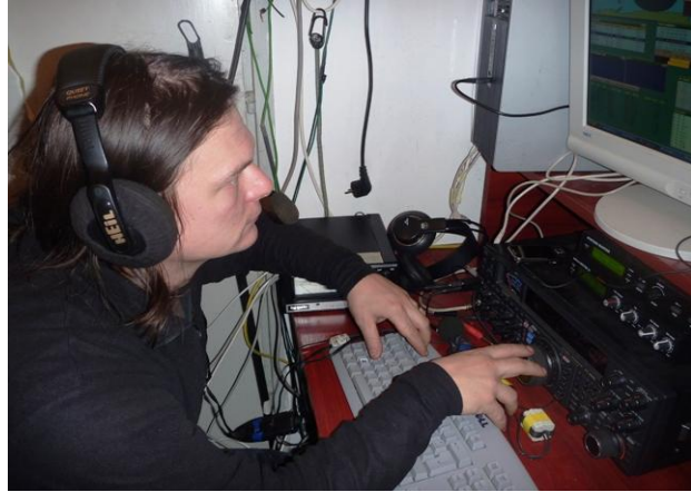
Braco, ma stizemo ih (uz2m) sigurno .... (Mult 2)