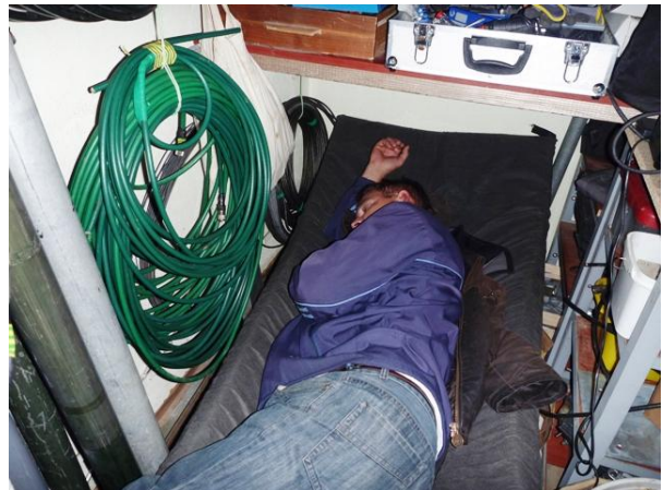
Rade, prije ili kasnije umor stigne (sokara)