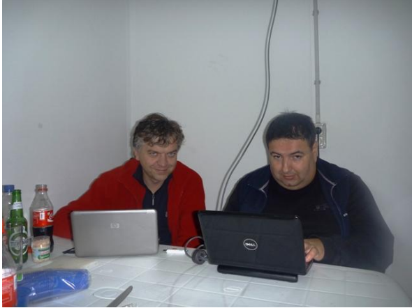
Kreso i Zoka, eh ti software guys... (kontejner)