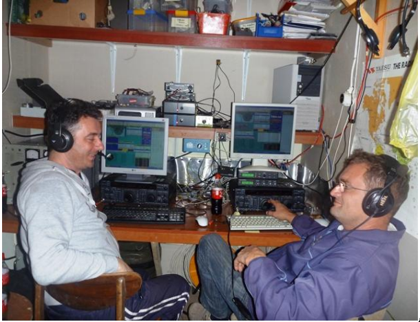
Fudo i Rade ,opusteno i raspolozeno (Mult 1)