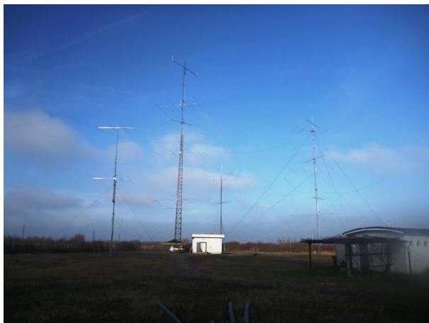
Novi stack za 28 na krajnjem lijevom stubu.