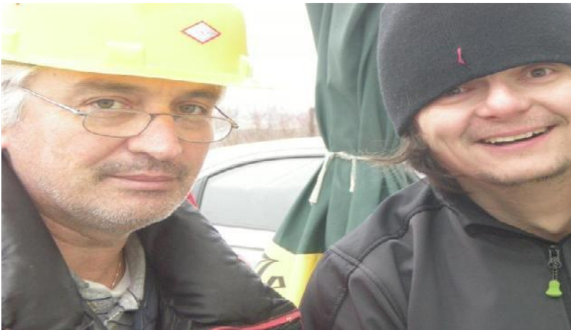
Rad na antenskim sistemima podrazumijeva i upotrebu HTZ.. E70R/E77DX

Drugo jutro završavamo sa solidnih 1700 veza, od toga je NA 413 veza. Prestajemo sa radom oko deset sati. Nadali smo se da ćemo nekako dopuzati do 2K veza... Pauza.