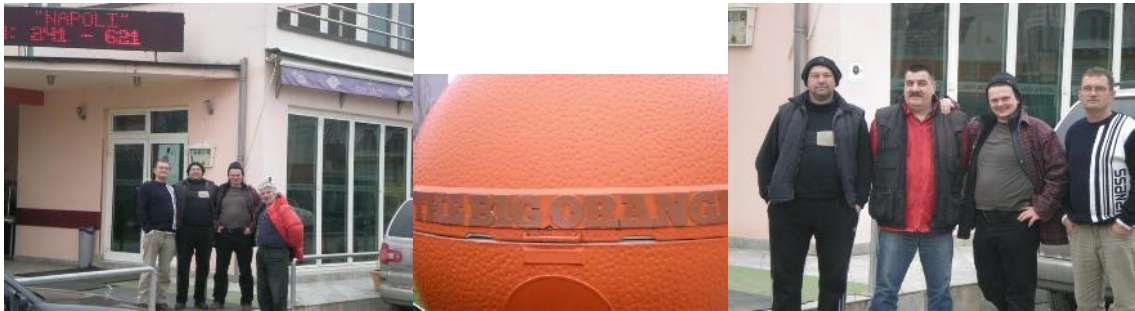
E74IW, E77E, E77DX, E70R ..... Grupne fotografije ispred picerije ... E77E, E70T, E77DX, E74IW

rucka je bio posebno protkan dobrim raspoloženjem, bez obzira što niko od nas nije posteno spavao ni dva sata proteklu noc.