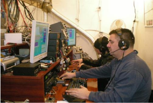
Zahuktava se , pocinju Japanci... E77DX/E70T